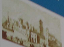
Bari, la Città e il Porto nel 1900.