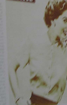
... di una donna ... che ha fatto ... una grande ... carriera ... nel mondo ... della moda.