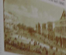
Bari, Corso Vittorio Emanuele nel 1908.